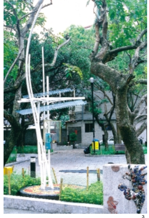
4 鳥籠外的花園(敦化藝術通廊) /徐秀美